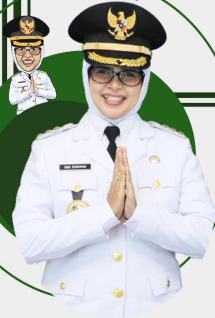
Hj. Rini Syarifah Bupati Blitar

Tanggal 9 Desember 2020 menjadi tahun pertama diselenggarakannya pemilihan serentak Kepala Daerah diberbagai wilayah di Indonesia. Pemilihan Kepala Daerah serentak dilaksanakan di 270 daerah dengan rincian 9 provinsi, 224 kabupaten dan 37 kota. Hal ini menandakan diberbagai daerah di Indonesia akan memiliki pemimpin baru. Bertepatan dengan situasi pandemi Covid-19, pelaksanaan pilkada serentak dilaksanakan dengan protokol kesehatan yang ketat mulai dari penyelenggara hingga pemilihan.